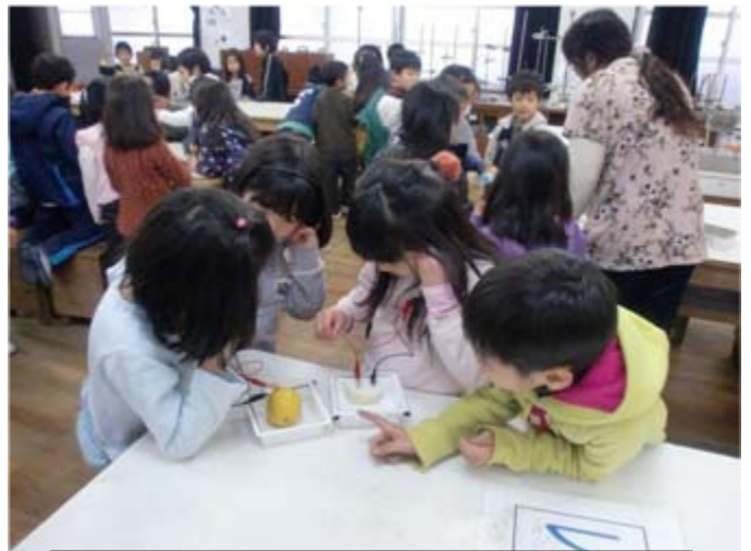
レモン電池で鳴る電子メロディーを聞いている児童

子供たちは科学の実験が大好きです。「レモン電池」の実験では、レモンに銅の小さい板とマグネシウムの板を突き刺し、コードでつなぎますと電気ができて、