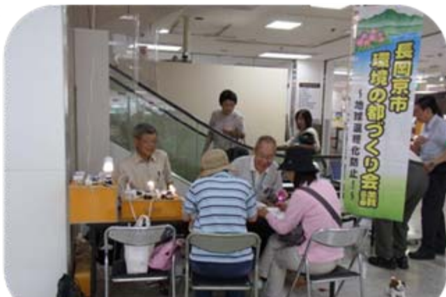
イズミヤ長岡店での省エネ相談会の様子