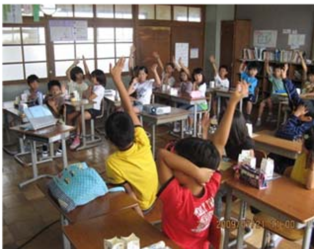
環境学習で元気に手を上げる児童たち

環境学習以外にもすすく教室（放課後子ども教室）や、各小学校の子ども祭りなどで、子供たちと一緒に、いろいろな「環境科学あそび」をします。