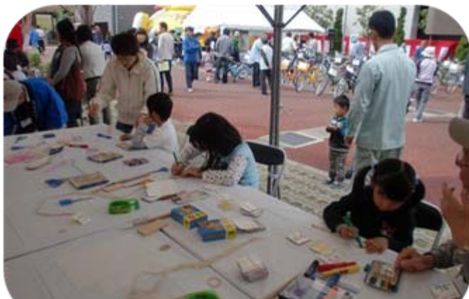
リサイクルフェアでリサイクル工作を楽しむ子供たち