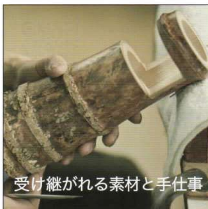
受け継がれる素材と手仕事