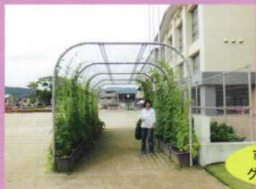
市内各小学校の グリーンカーテン