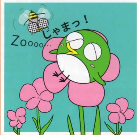
ミヤコちゃんのエコまんが 作: 船越 聡