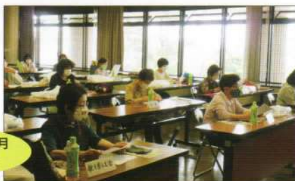
令和2年6月 評議員会

女性の会では、毎年5月に会員の皆さんにゴーヤの苗を配布し、地球にやさしいグリーンカーテンの取り組みをしています。また緑の協会の方がご用意されたゴーヤの苗を同じ取り組みをされている各小・中学校へお配りするお手伝いもさせていただいています。未来の子供たちのために、私たちも地道な努力の継続をしていかなければならないと考えています。私たちの活動が、少しでもお役に立てれば幸いです。