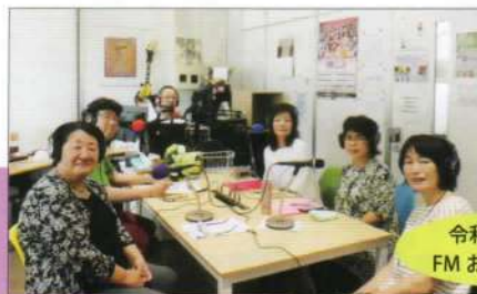
令和元年7月 FM おとくに出演