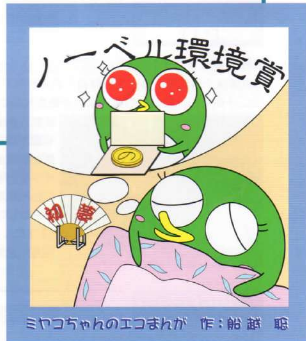
ミヤコちゃんのエコまんが 作:船越聡