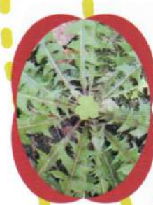
タンポポカタバミ