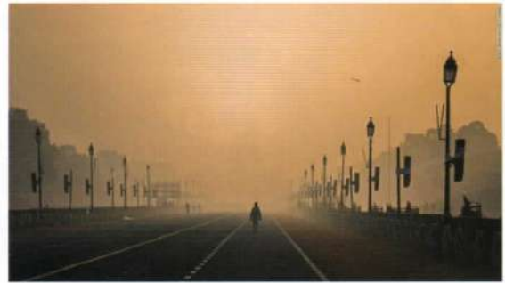
スモッグがかすむ街中を歩く男性=2021年1月、インド首都ニューデリー