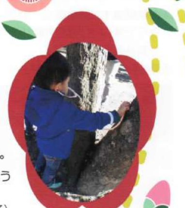
木の鼓動を聴く子ども