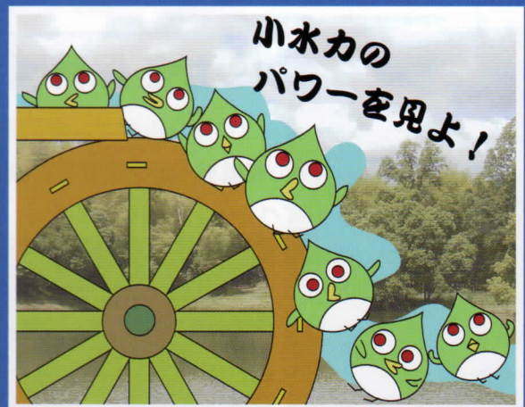
ミヤコちゃんのエコまんが 作：船越 聡

遠来のホテルあちはどうだった (こっちの水) 水無月に水が異常に多くあり (予報士) 超楽さエレキ作りは飲む前に (小水力) 北の米誰か喰わぬと埒あかん (青リボン) トランプで手ぐすね引いてる奴もいる (新法) これなんと読むかと孫にしたり顔 (紫陽花) 多過ぎる プラ製品を 減らさねば (M生)