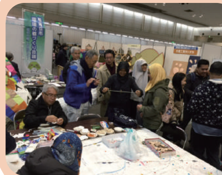
当ブースに来訪された マレーシア視察団の皆様